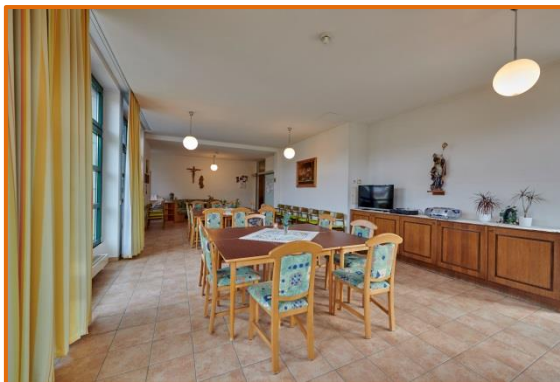
Der einladende Wintergarten dient als Ort der Begegnung