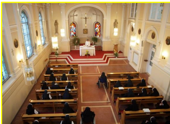
Seelsorgliche Begleitung sowie die Teilnahme am Gottesdienst sind jederzeit möglich